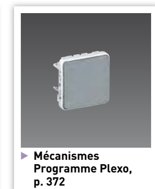
Mécanismes Programme Plexo, p. 372