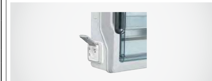
Intégration dans coffret Plexo 3 apparent